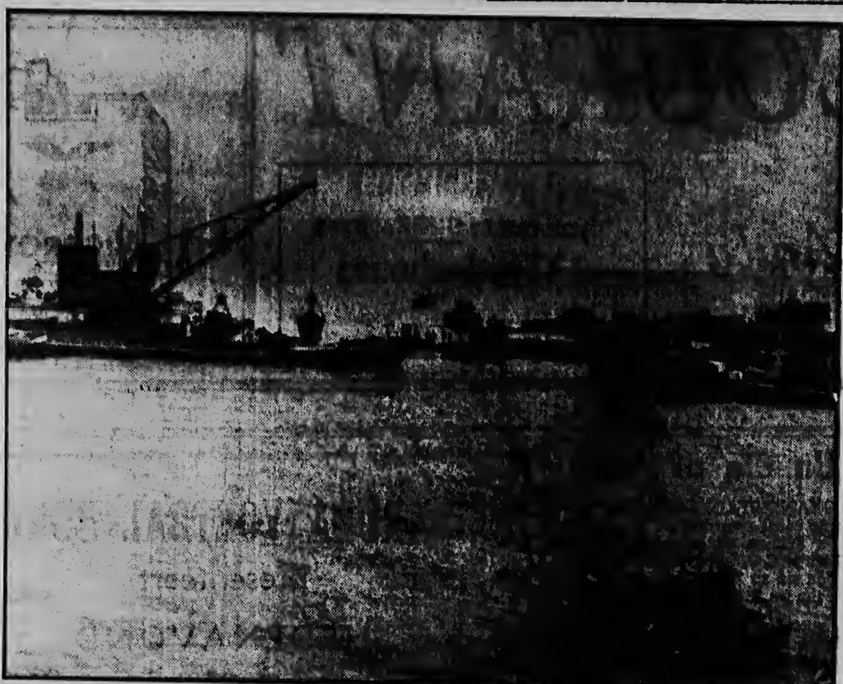
Sluiting van de 90 km lange dijk van Oostelijk Flevoland.